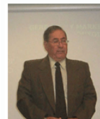
odontomarketing lo no odontológico de la Odontología

Lo saludamos en nombre del equipo de Odontomarketing, para darle la más cordial bienvenida a nuestro Servicio de Asesoría. Agradecemos y valoramos su interés por nuestro trabajo, por lo que nos enfocamos en brindarle un servicio personalizado que satisfaga sus expectativas. Queremos compartir con Usted los detalles de la Asesoría (Modalidad Virtual), para que evalúe la opción de contratar nuestro servicio, que incluye soluciones de Gerencia, Administración y Marketing en Odontología.