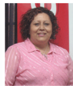
odontomarketing lo no odontológico de la Odontología