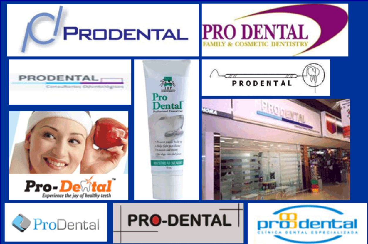
Se muestra un material de difusión pública, con fines didácticos