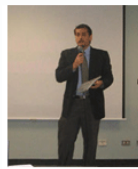
odontomarketing lo no odontológico de la Odontología