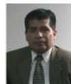
odontomarketing lo no odontológico de la Odontología